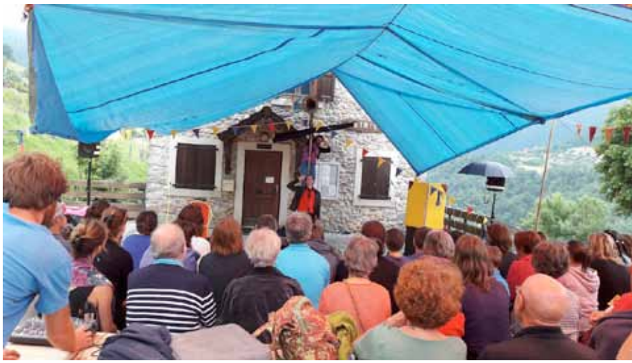
Souvenir d'un été animé à Sainte-Agnès : spectacle de la Cie Artiflette avant le bal populaire