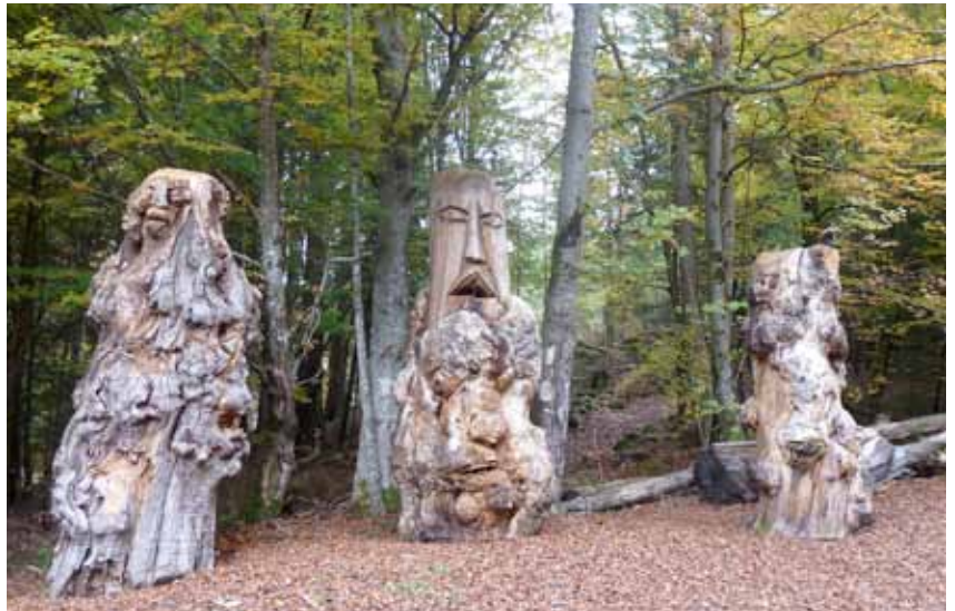
Gardiens de la forêt, sculptures de Jean Rosset Boulon

✍ Le S.D.A.E.P. Schéma Directeur d'Eau Potable qui nous permet de bien connaître nos installations (captages, réservoirs, réseaux, branchements), de localiser les fuites et de les réparer (ce qui a été fait cet été), et de projeter et hiérarchiser les investissements nécessaires qui seront portés par la Com-Com du Grésivaudan en 2018. Il sera présenté vendredi 2 décembre.